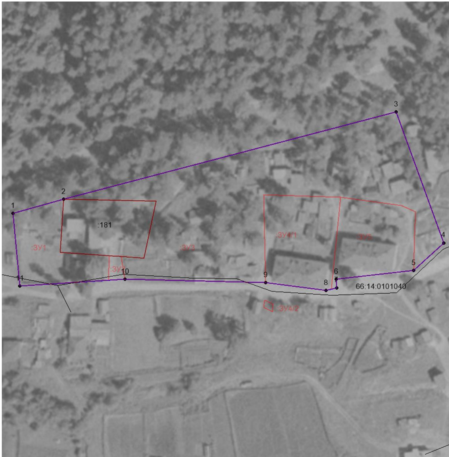
Схема красных линий М 1:1200