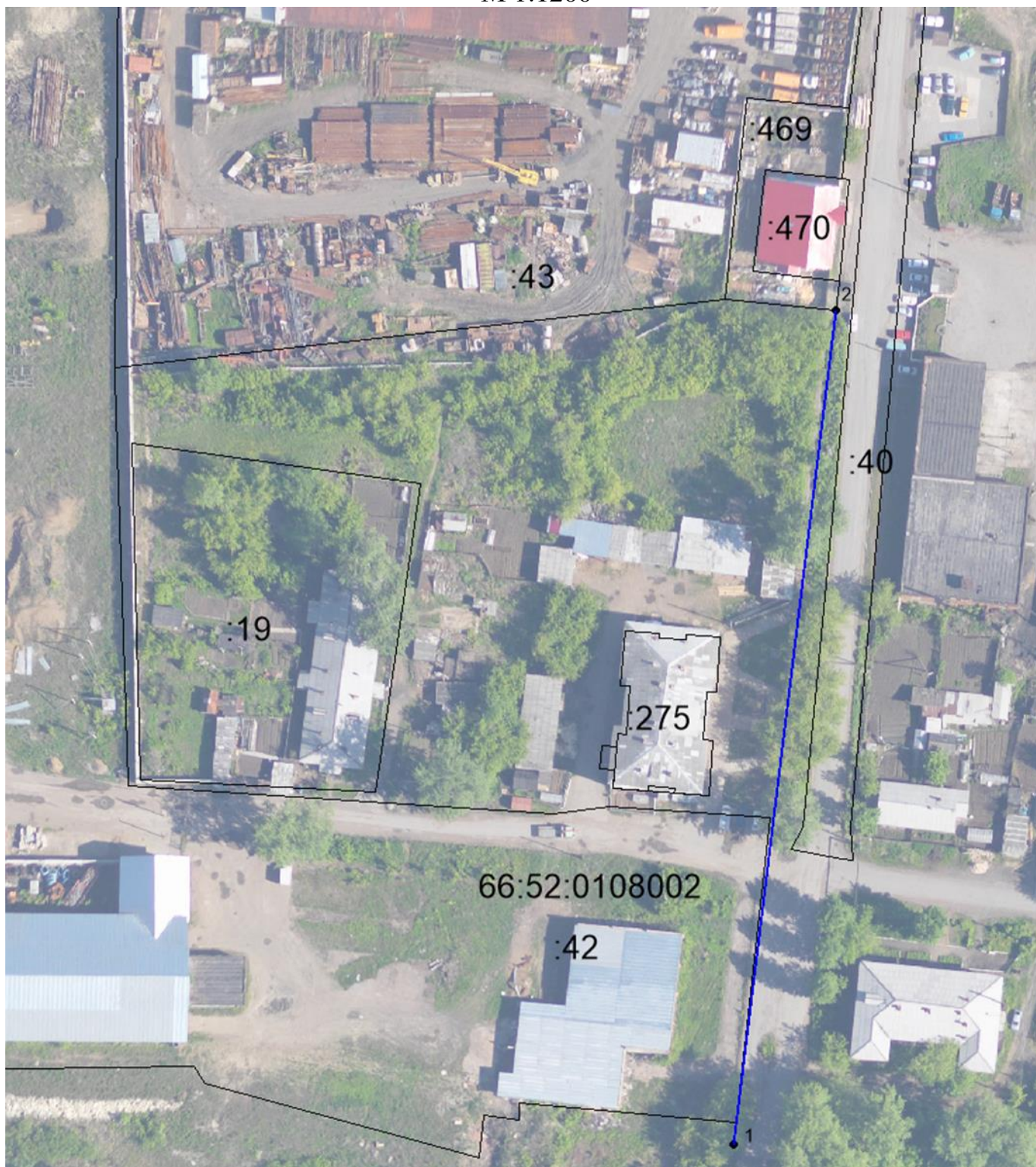
Схема красных линий М 1:1200