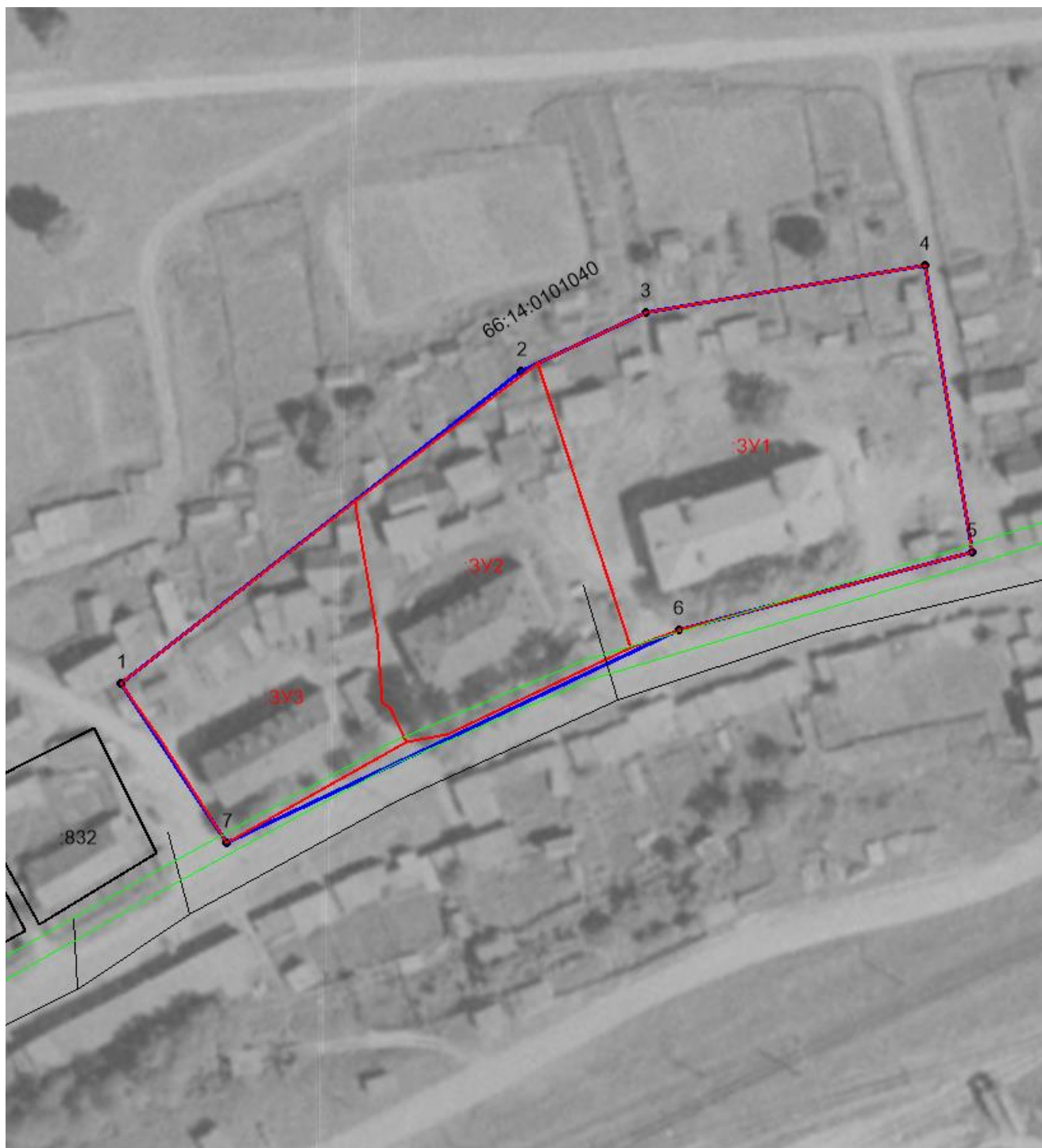
Схема красных линий М 1:1200